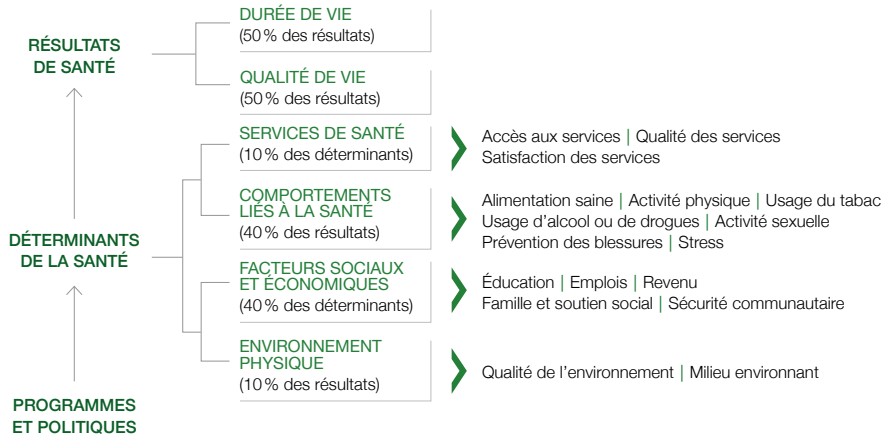
Figure 2. Modèle de la santé du programme

Les étudiantes et étudiants diffuseront les résultats de leur thèse aux communautés étudiées. Ainsi, ce programme développera une culture collaborative de recherche interdisciplinaire qui implique et bénéficie la communauté.